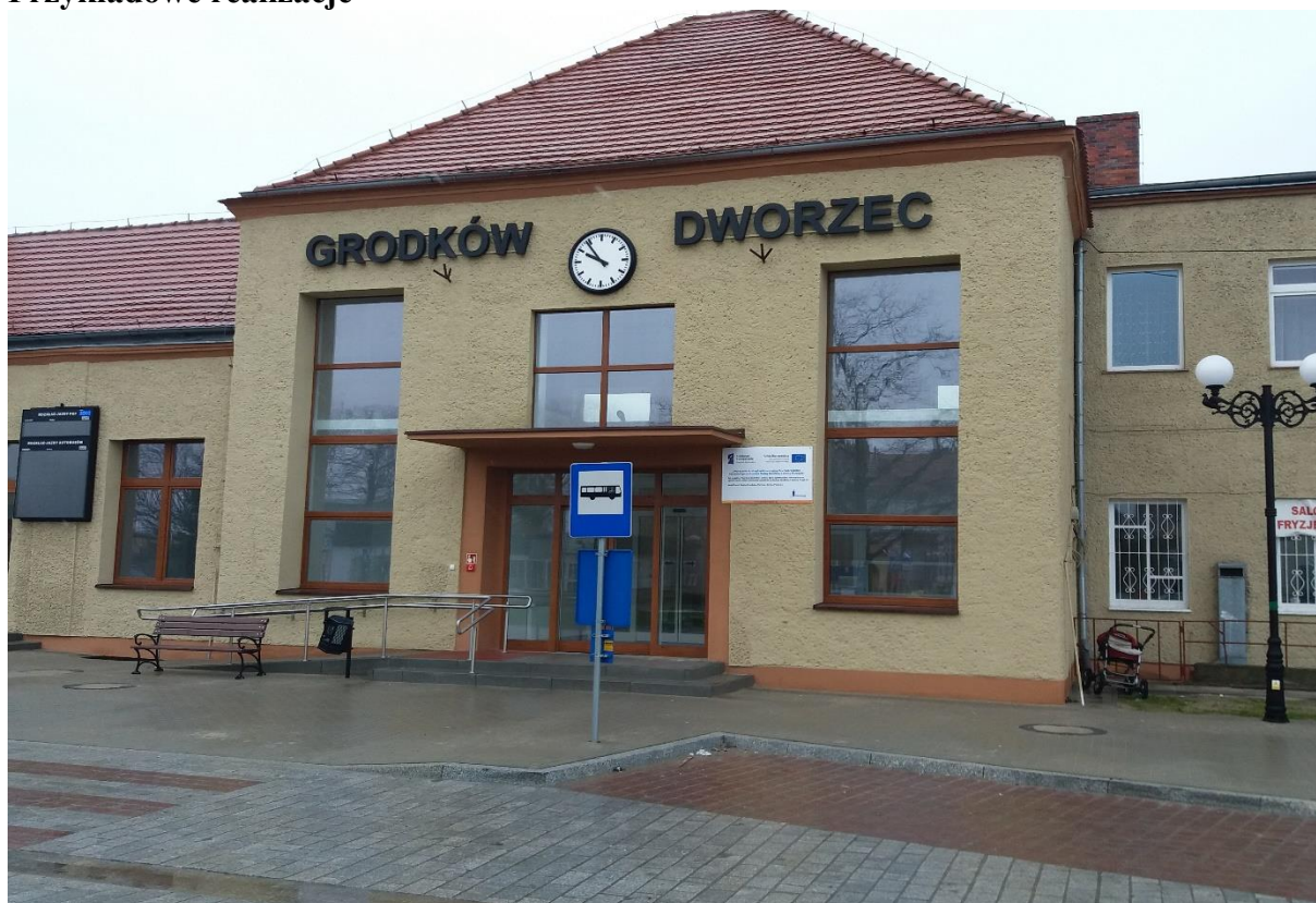
Dworzec w Grodkowie