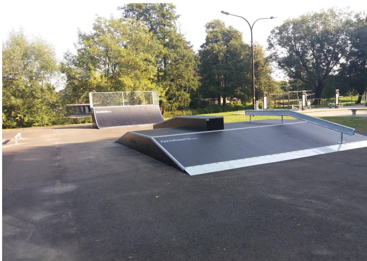
Skatepark w Grodkowie