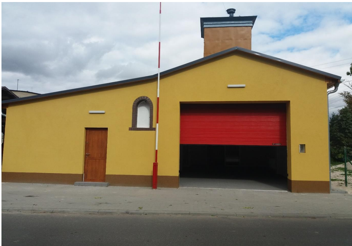
Remiza OSP w Gałązczycach