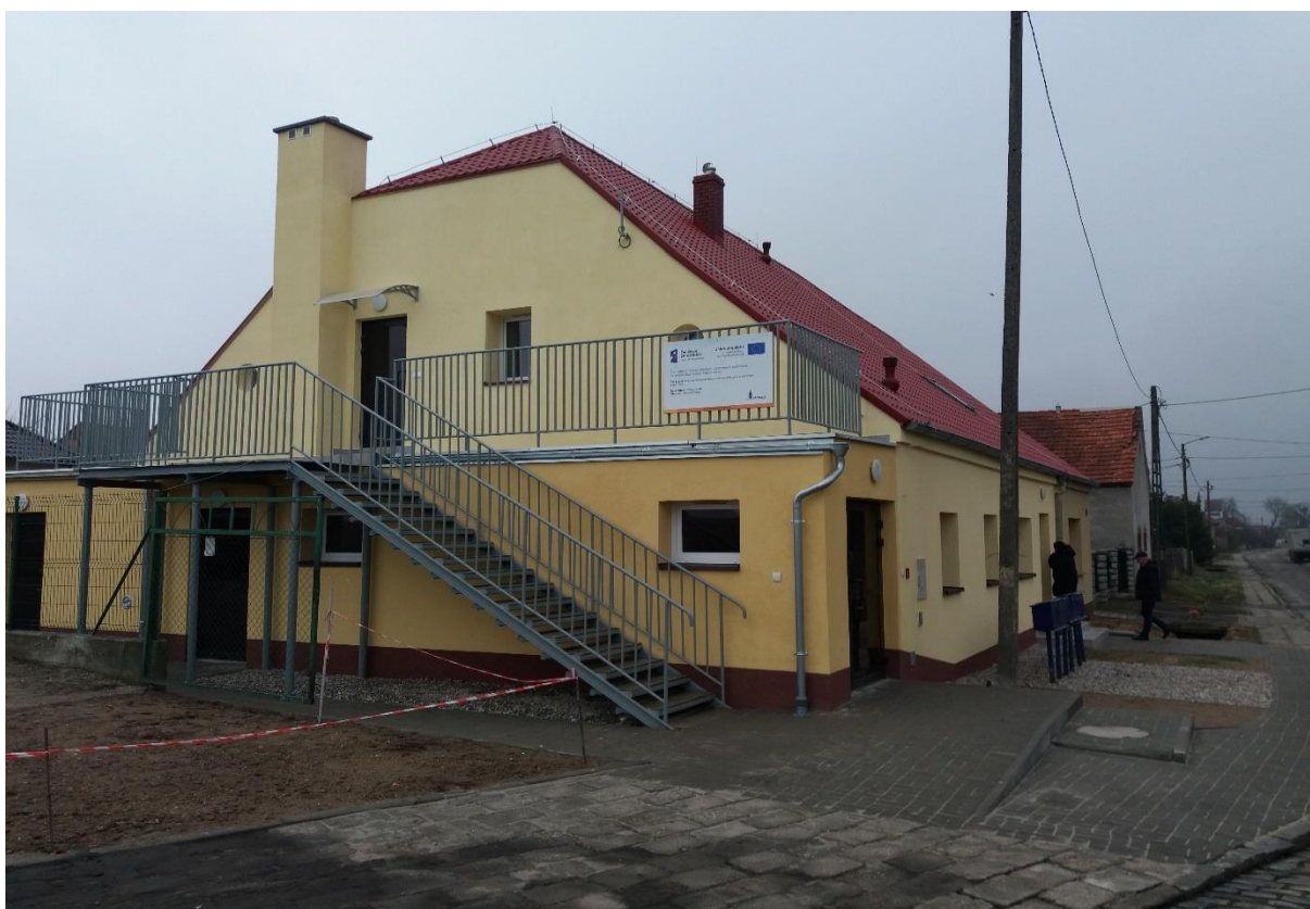
Świetlica wiejska w Goli Grodkowskiej