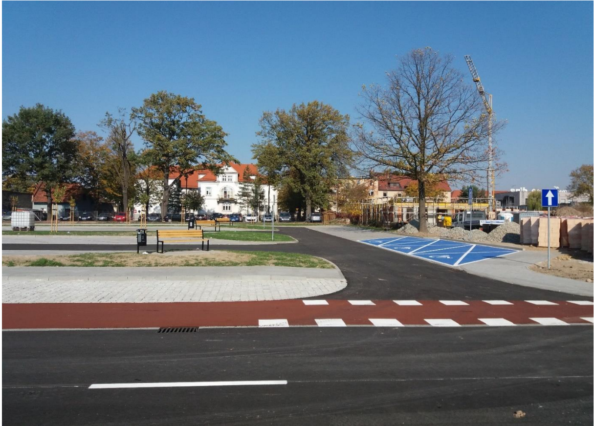
Ulica Sportowa od ul. Warszawskiej do ul. Kasztanowej